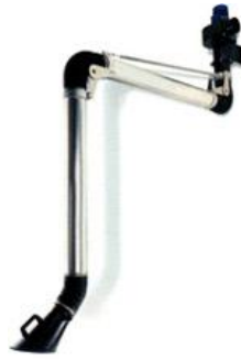
Bracci aspiranti serie AL